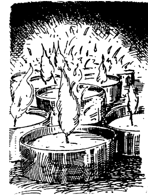
Ria van Duijn

zondag 6 april 2024 1e zondag na Pasen Uitgeest, Prot. Kerk 'Vandaag geloven...'